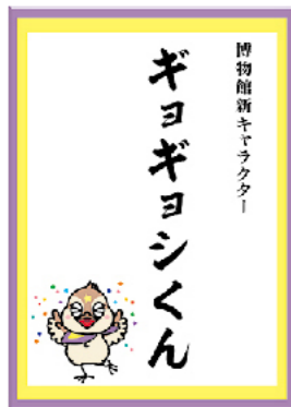
昨年11月3日のお披露目での命名書

ギョギョシくんの活躍で、区民の皆さんの『葛飾愛』が一層深まっていくことを願っています。これからも博物館とギョギョシくんの応援よろしくお願ひします。