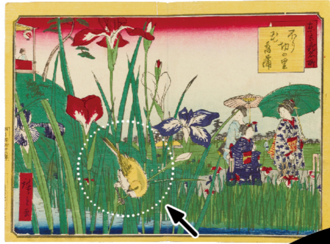
東京花名所「ほり切の里花菖蒲」明治12年 三代歌川広重作